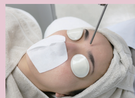
装着イメージ (写真はSサイズを着用)