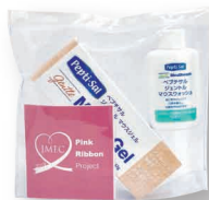
ペプチサル ピンクリボン限定キットの販売