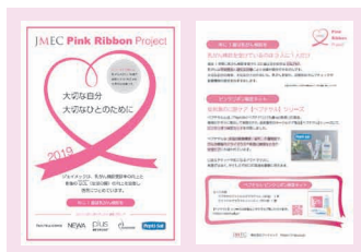
パンフレットの配布