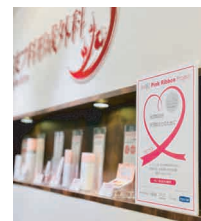
ご賛同いただいたクリニック様の待合などでの掲示