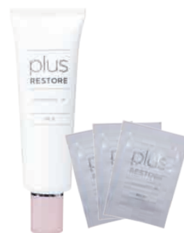
デリケートな肌にしみない 保湿乳液 スキンモイスト W