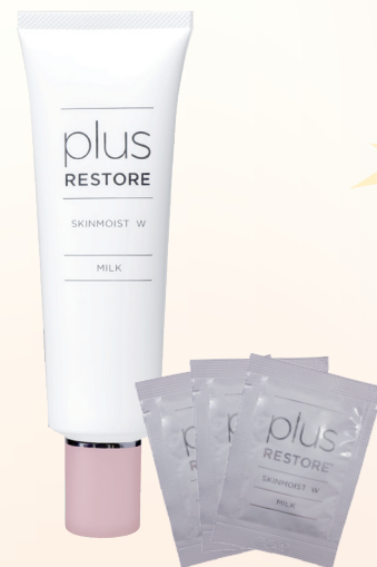
デリケートな肌にしめない保湿剤 スキンモイスト W